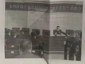
2月23日,金凤区综合审判庭举办2022年“百日学法”行政执法规范化培训会议。

对象观看网络诈骗案件视频,动员他们在学习的空闲时间亲朋好友普及反诈常识,及时下载安装“国家反诈中心”APP,共同提高反诈、防骗意识。