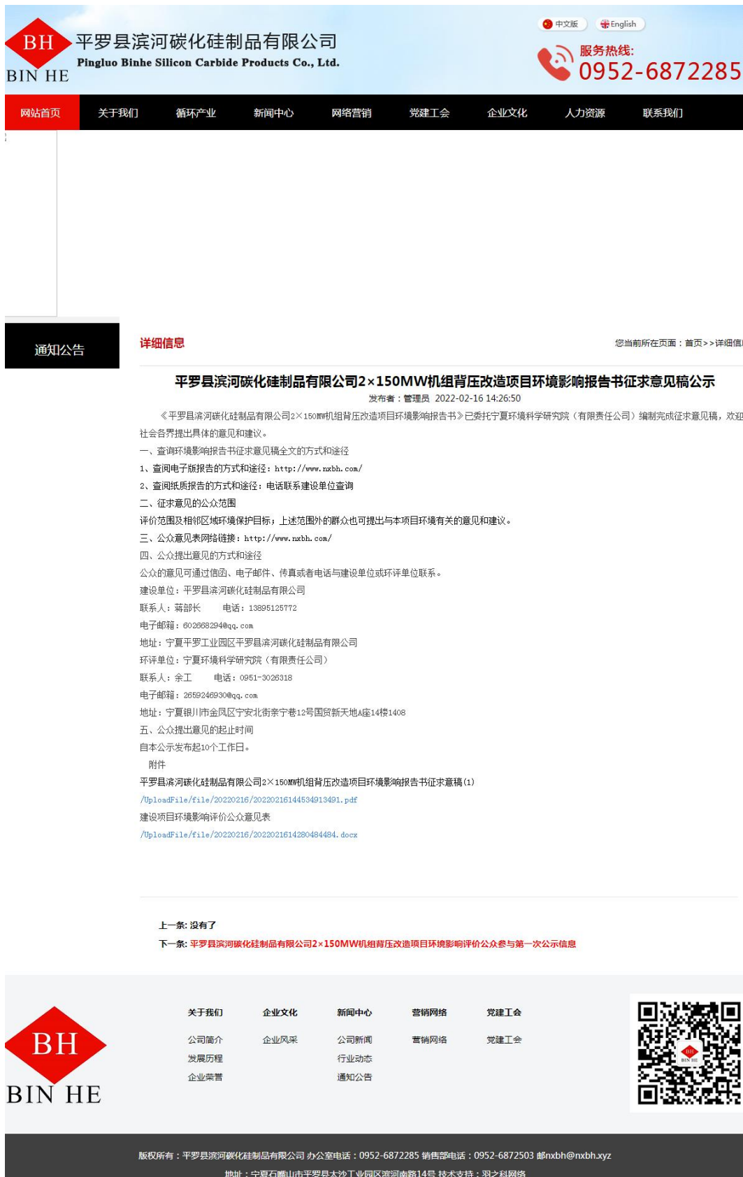
图 0-1 网站征求意见稿公示截图