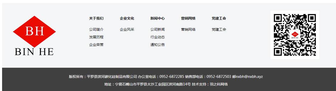
图 0-1 第一次环境信息公示图